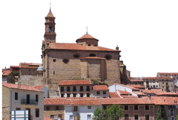
Orihuela del Tremedal

Despedida y regreso de cada uno a su lugar.