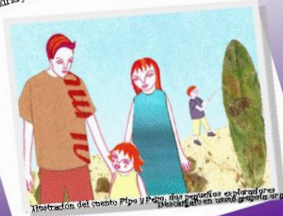
Ilustración del cuento Pipa y Pico. Los pequeños exploradores descubrieron en su mundo grapsia.org

Nuestro primer encuentro fue en el año 2004 en el Hospital La Paz de Madrid y la constitución legal como Asociación de ámbito