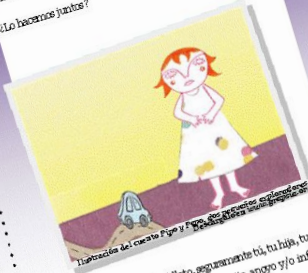
Ilustración del cuento Pipa y Pico. Los pequeños exploradores descubrieron en su mundo grapsia.org

GrApSIA nació con la idea de que padre debería vivir en soledad una condición como ésta. Consideramos que hay una gran diferencia entre experimentar la soledad y hacerlo acompañado. ¿Lo hacemos juntos?